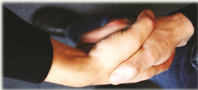
Text und Foto: Pro mente OÖ

ich und mein Team möchten uns für das von Ihnen entgegengebrachte Vertrauen bedanken und wünschen Ihnen ein gesegnetes gesundes Weihnachtsfest und einen guten Rutsch ins neue Jahr 2020!