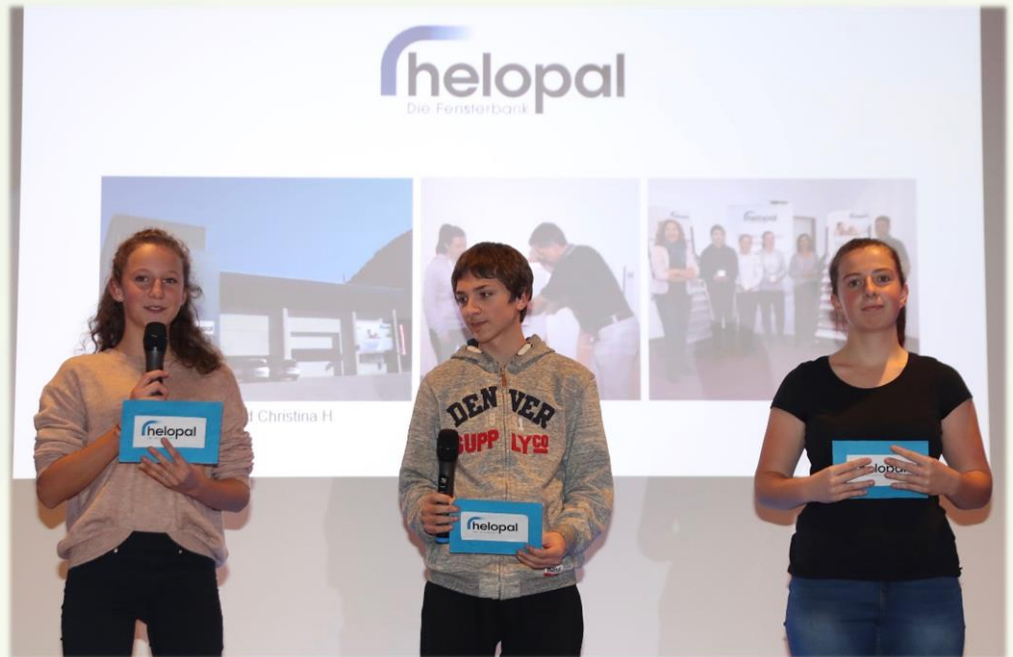
Vor vielen Menschen sprechen – auch das lernen die SchülerInnen der NMS Reichraming

Diese Erfahrungen konnten sie im Projekt „School@Company“ in Betrieben in der Region anwenden.