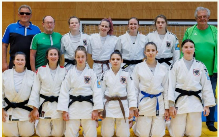
Unsere beiden Bundesliga-Teams