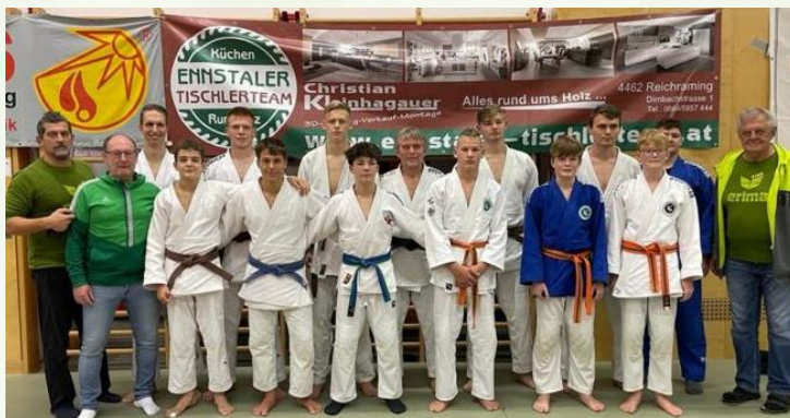
Mannschaft der Herren-Landesliga B