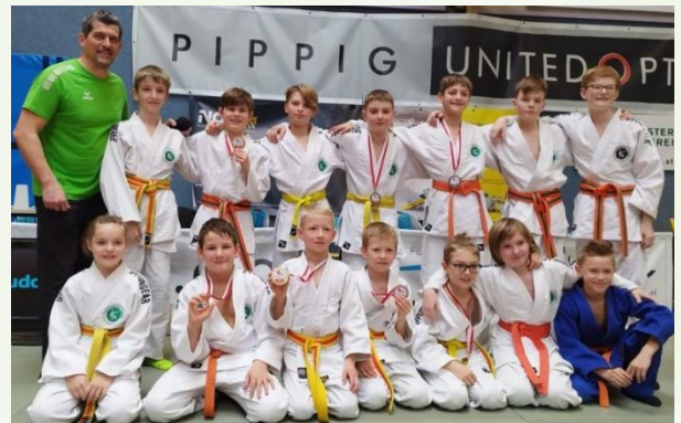
tolle Platzierungen bei den Schüler-Landesmeisterschaften

Bei den Landesmeisterschaften waren unsere Judokas ebenfalls sehr erfolgreich. Sowohl bei den Schülern und Jugendlichen als auch in der allgemeinen Klasse wurden Siege eingeehmt. Ebenso bei der Schüler-Mannschafts-Landesmeisterschaft U14/U16 errangen unsere Sportler/Innen den 1. Platz. Insgesamt 44 Medaillen waren die Ausbeute (21 x Gold, 16 x Silber, 7 x Bronze).